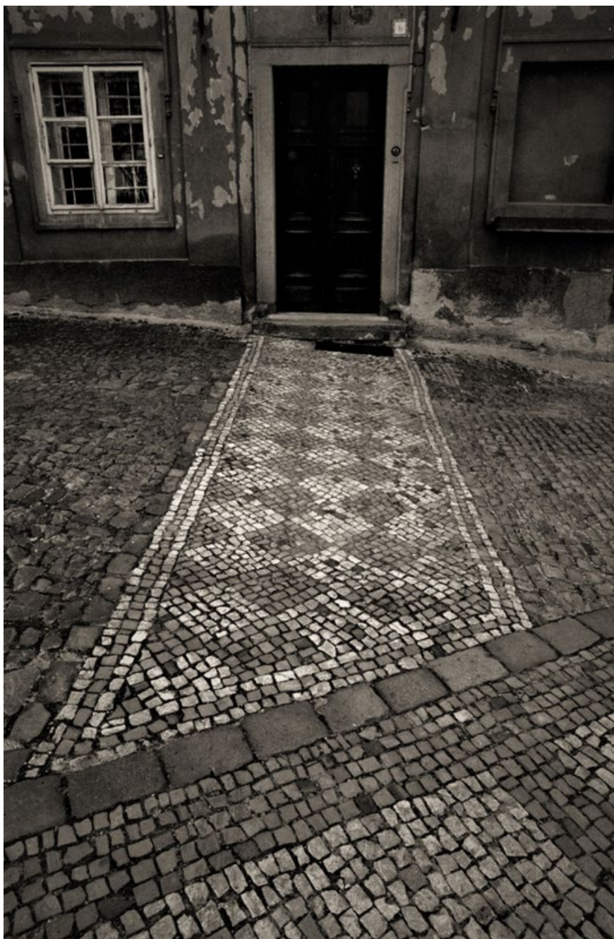
Z cyklu dlažeb, sedmdesátá léta