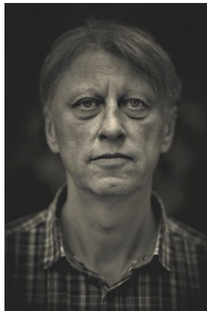
Jáchym Topol (*1962)