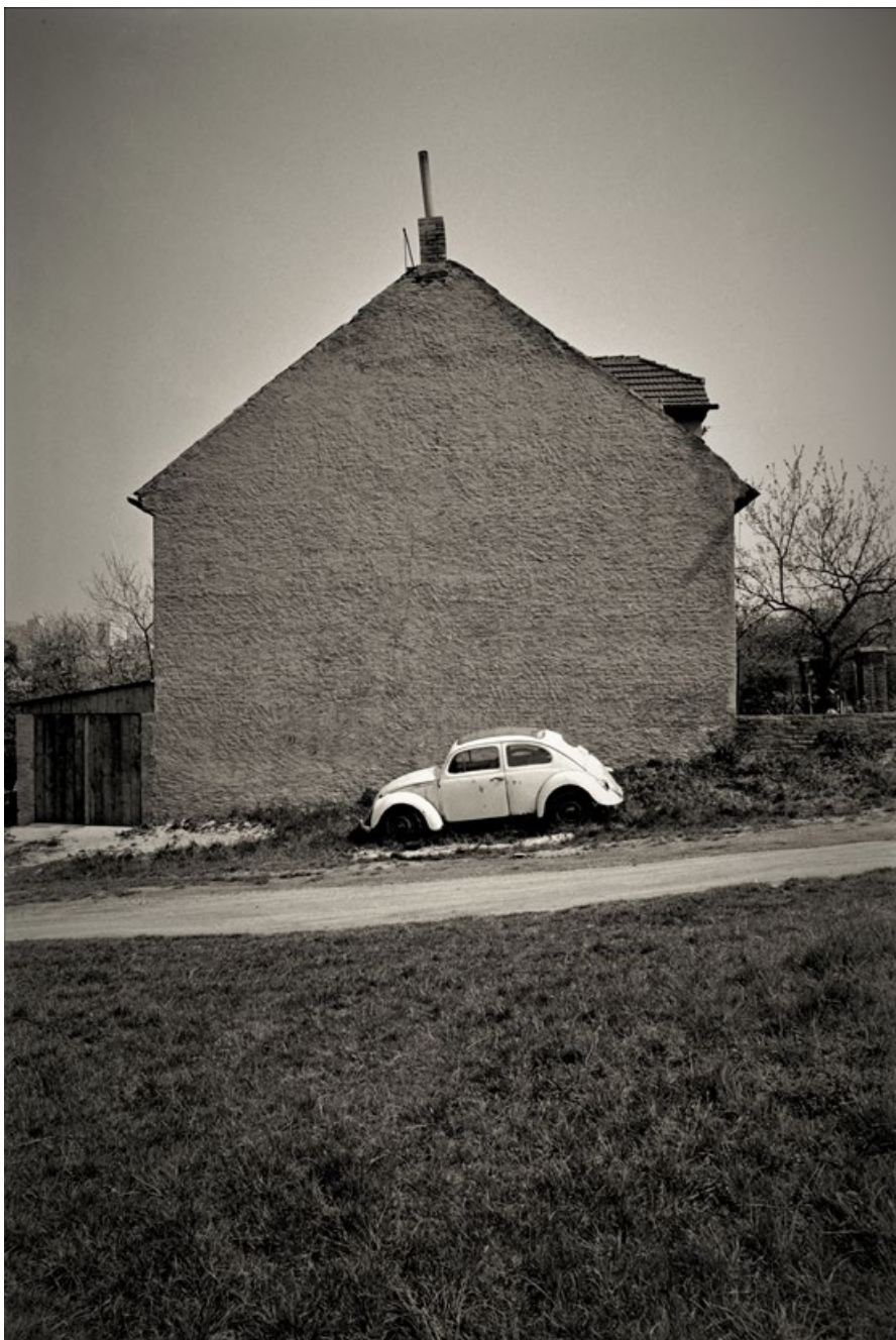
Z cyklu periferií, sedmdesátá léta