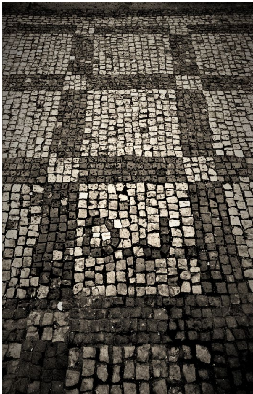
Z cyklu dlažeb, sedmdesátá léta