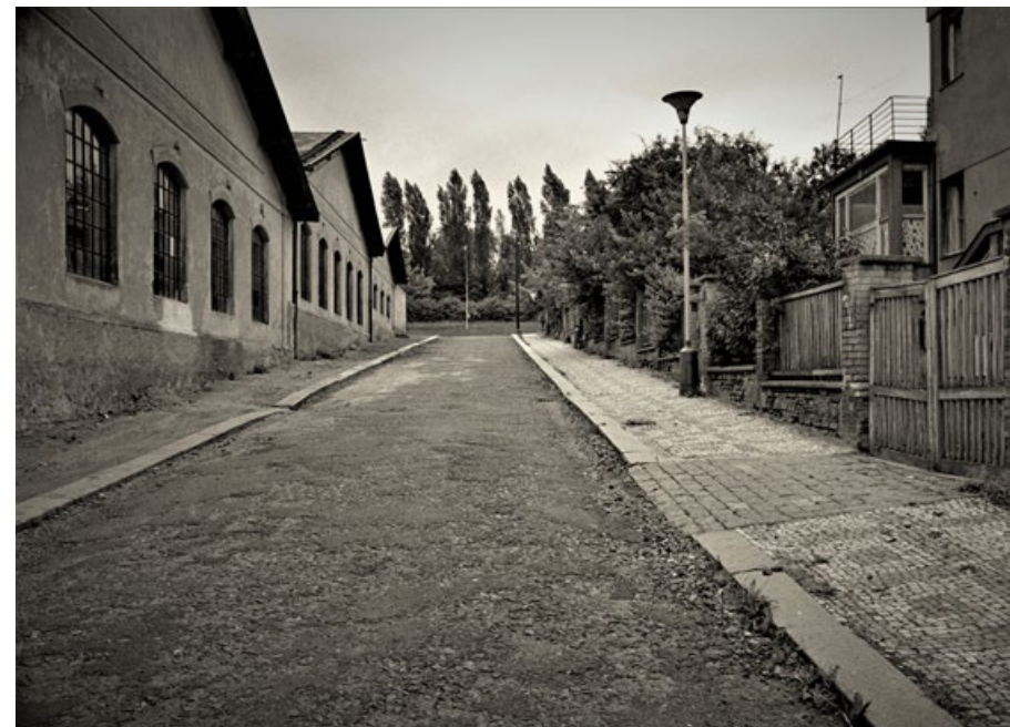
Z cyklu periferií, sedmdesátá léta