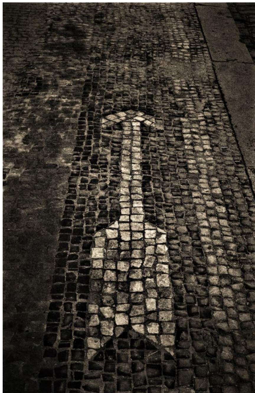
Z cyklu dlažeb, sedmdesátá léta