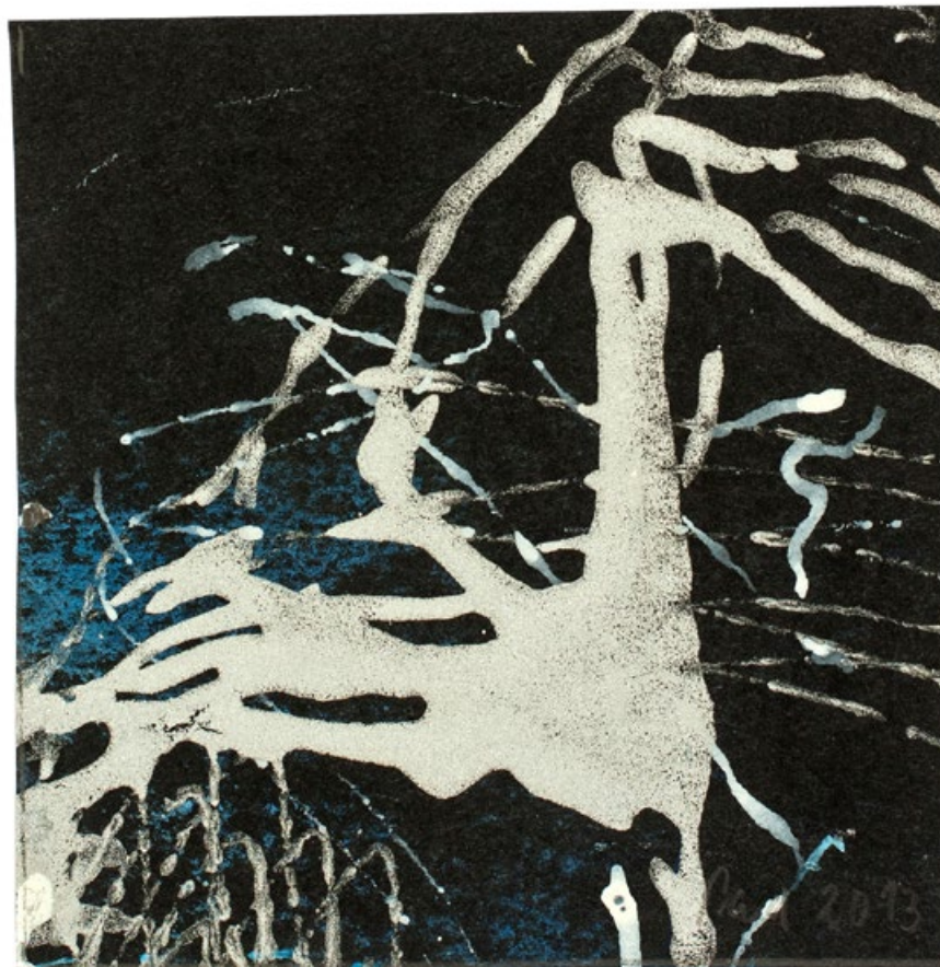
Stříbrný pták, květen 2013, stříbrná a modrá barva, černý papír, 125 x 122 mm

www.galerie-sumperk.cz / www.dksumperk.cz