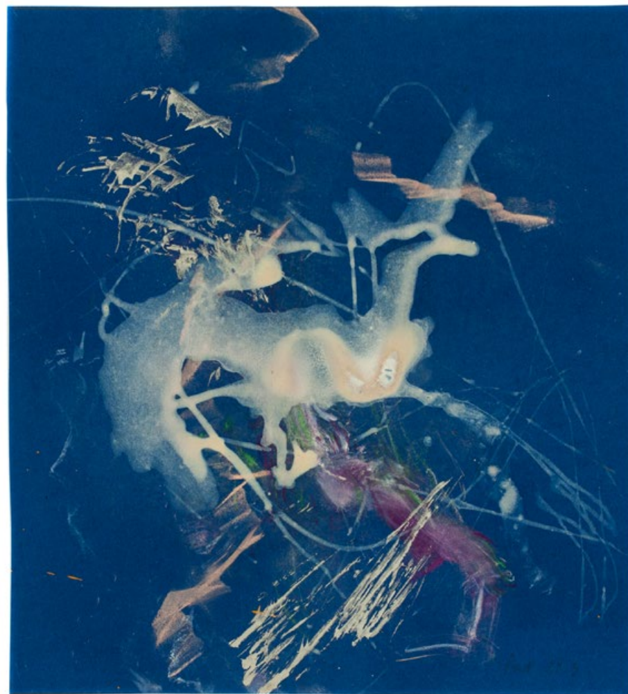
Laň, květen 2013, pastel, kresba větvičkou borovice stříbrnou a zlatou barvou, modrý papír, 278 x 252 mm