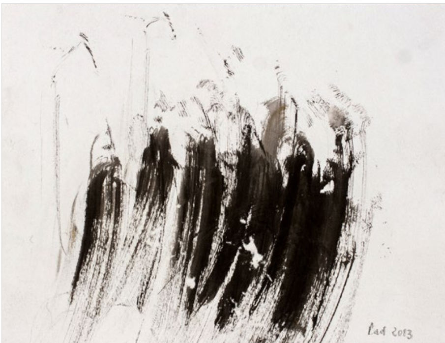
Lesní tišina, 2013, tuš na papíře, 180 x 210 mm