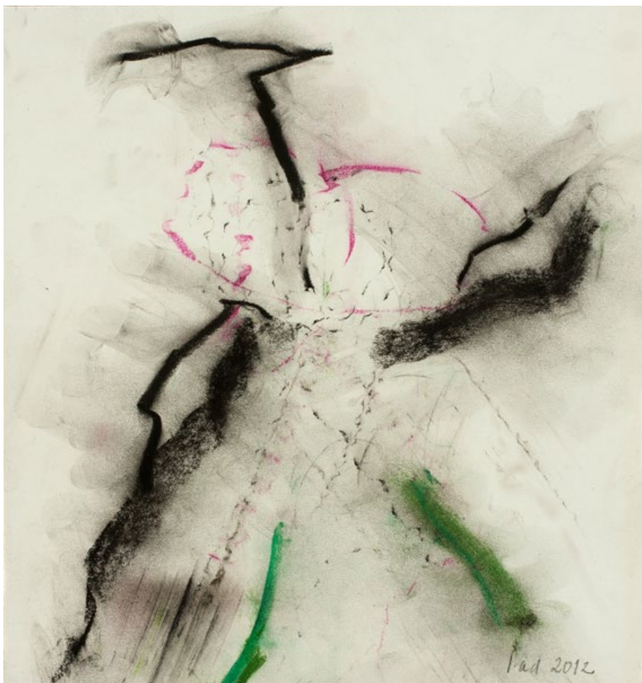
Křížák, září 2012, pastel na papíře, 246 x 229 mm