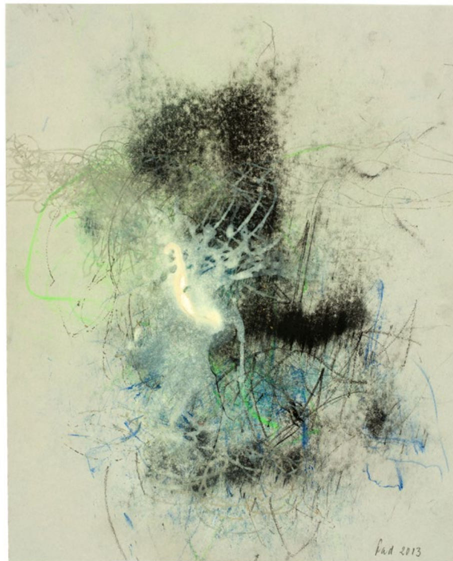
Ledový dech, květen 2013, pastel a bílá barva, šedožlutý papír, 334 x 270 mm