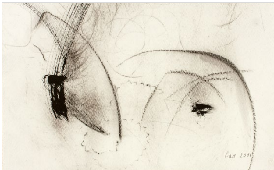
I jednooký vidí, říjen 2011, pastel a tuš na papíře, 154 x 250 mm