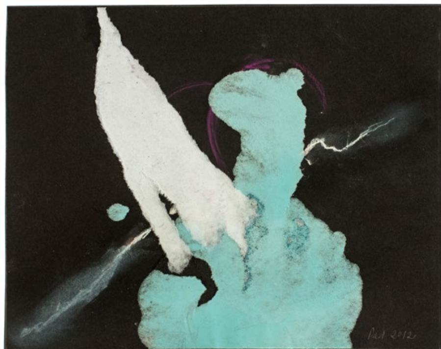
Kočka a pes, říjen 2012, pastel, bílý a modrozelený papír na černém podkladu, 220 x 278 mm