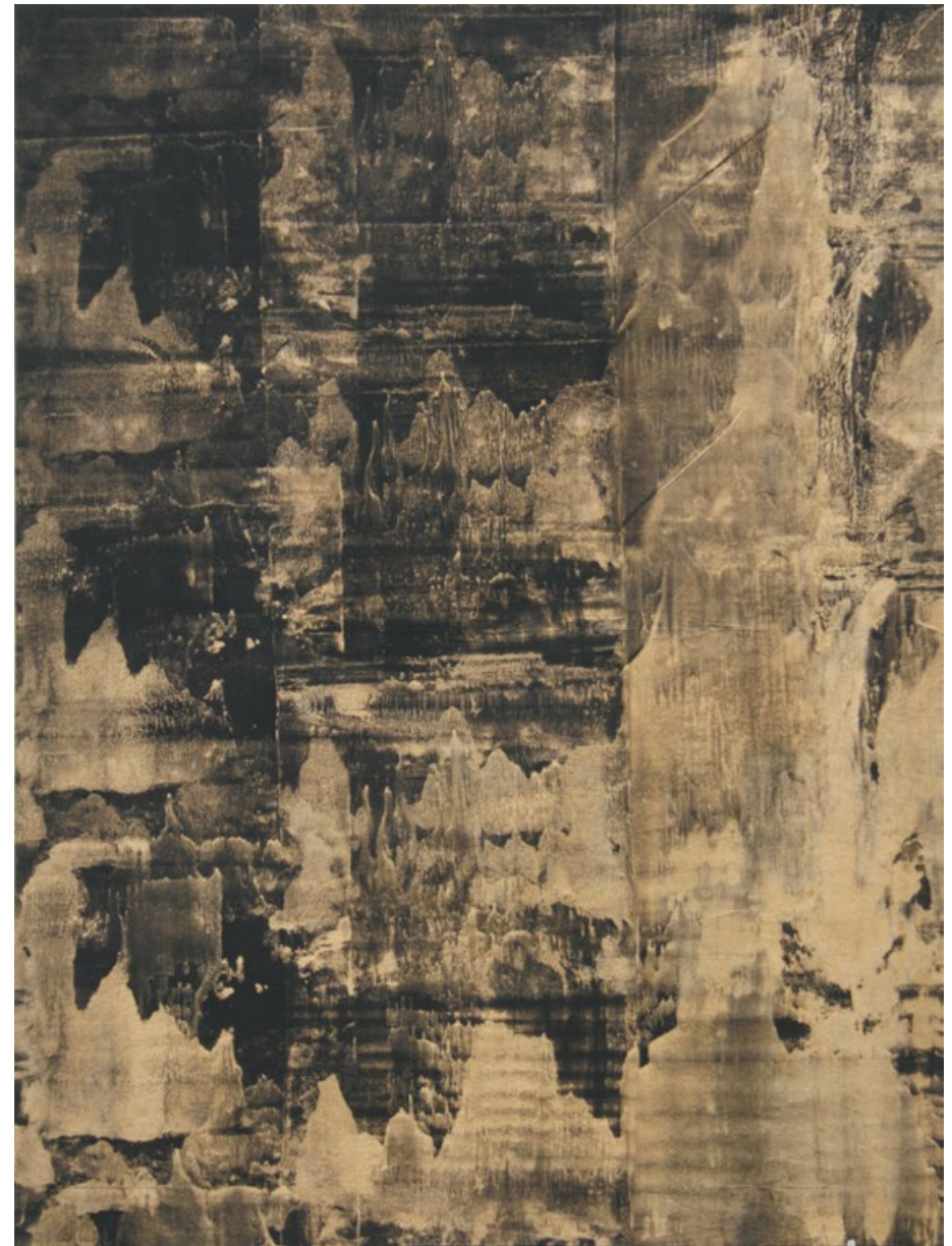
Zlatá krajina, 2013, akryl, olej, plátno, 120 x 90 cm