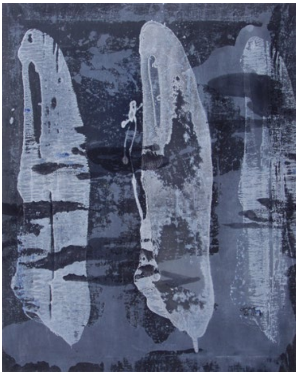
Bludičky, 2013, akryl, plátno, 100 x 80 cm