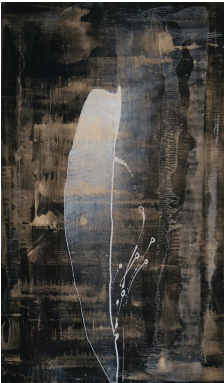
Silueta, 2013, akryl, plátno, 120 x 70 cm