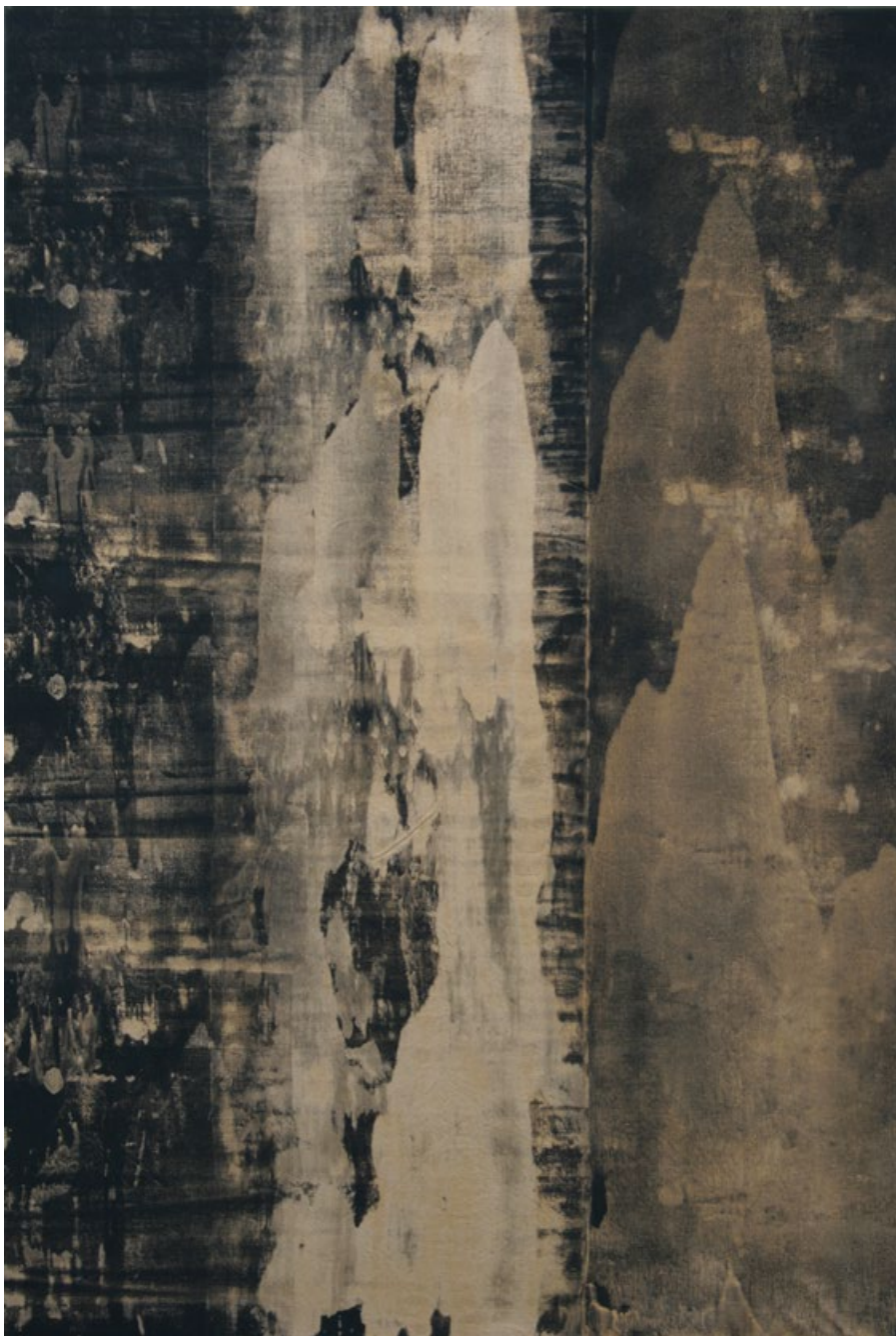
Černé hory I, 2013, akryl, olej, plátno, 120 x 80 cm