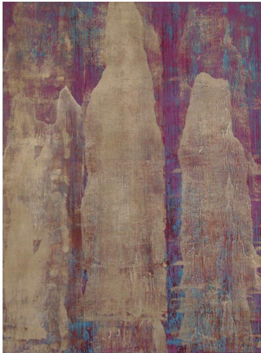
Čínské hory, 2013, akryl, olej, plátno, 120 x 90 cm