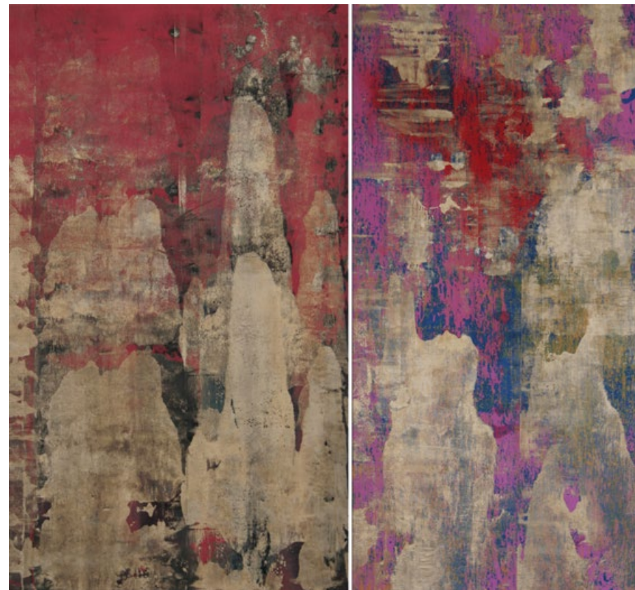
Rudé hory a Čínské hory, 2013, akryl, olej, plátno, 120 x 70 cm a 145 x 70 cm

www.patrikhabl.com / www.galerie-sumperk.cz