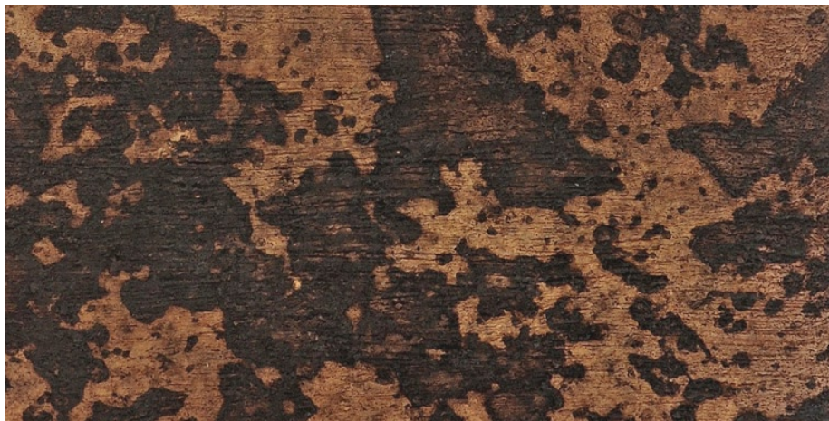
Kaplička, detail povrchu

můj ateliér na starém statku, tu cestu mezi kuchyní a ateliérem jsem šla snad tisíckrát, stotisíckrát pomalu, chvatně, jako ve snách se sluncem v nadhlavníku, i s miskou čaje v prokřehlých rukách opatrně našlapující opukových kamenů zarůstající travou můj ateliér na starém statku, můj travní grizzly