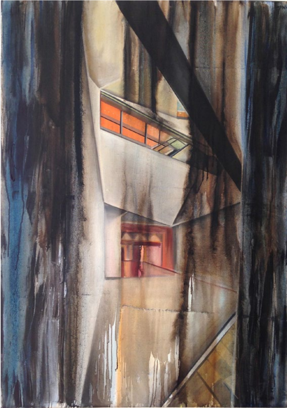
2nd Floor, 2015, olej, plátno, 140 x 100 cm