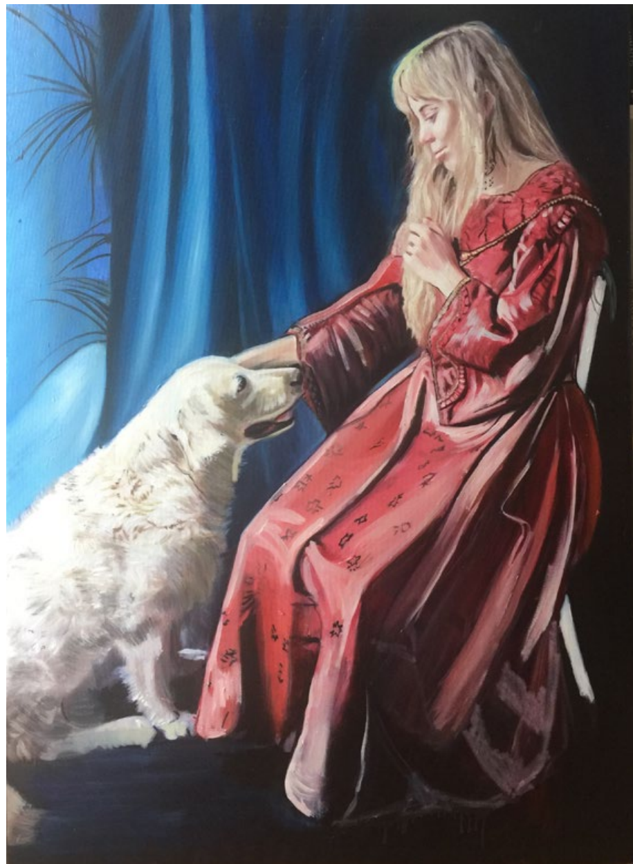
Renezance, 2018, olej, plátno, 110 x 80 cm