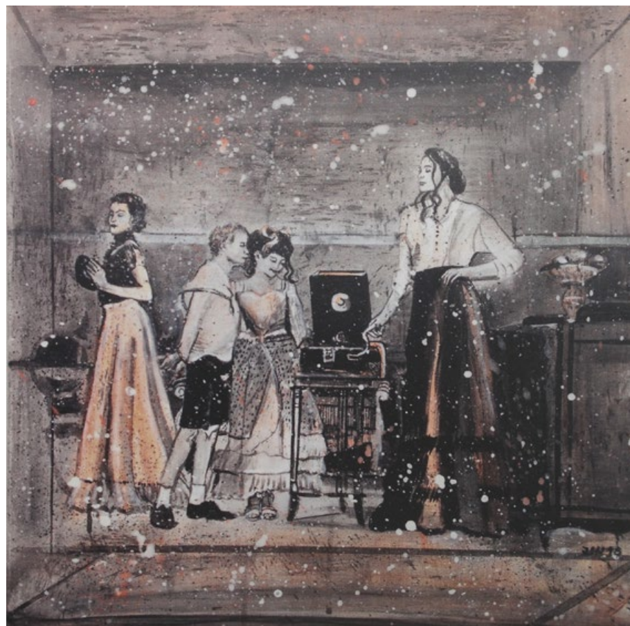
Nedělní odpoledne v Petrohradě, 2016, olej, akryl, plátno, 50 x 50 cm