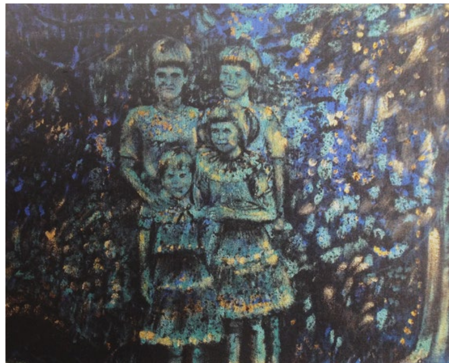
Dětství 2, 2011, akryl, plátno, 50 x 70 cm