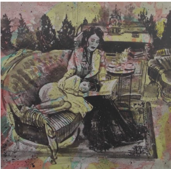
Sladké sny, 2016, olej, akryl, plátno, 40 x 40 cm