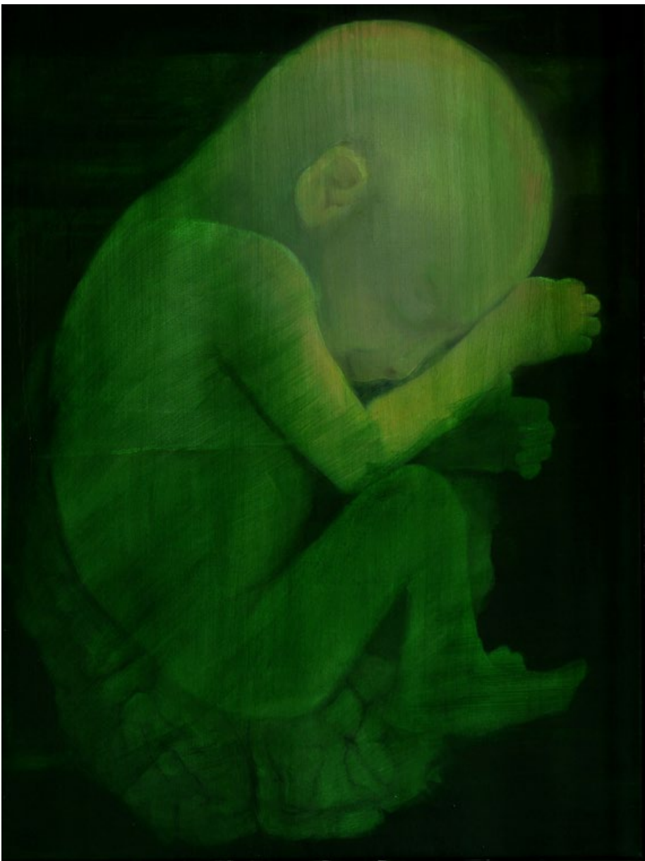
Přicházím, 2010, akryl, plátno, 100 x 75 cm