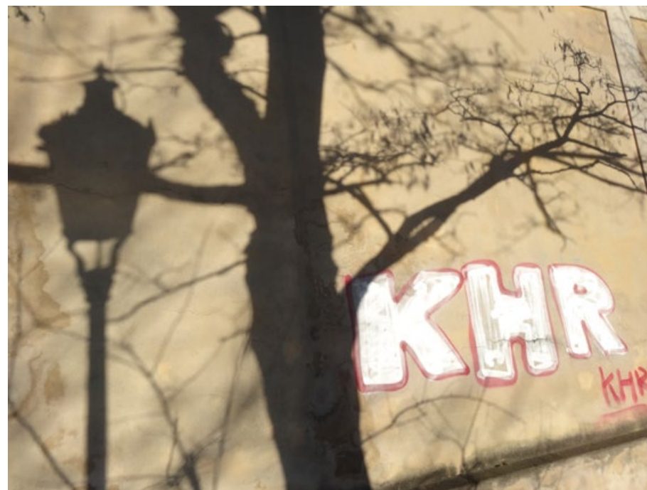
Jaromír Zemina, z cyklu Stíny, 2016