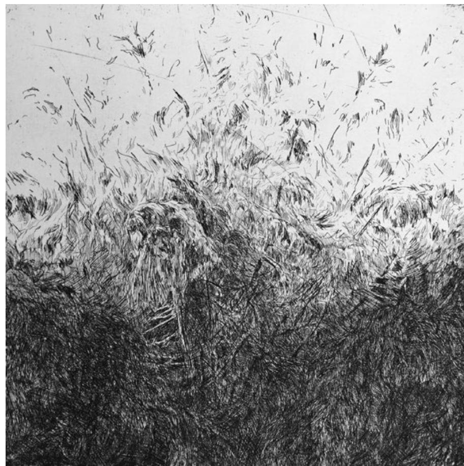
Šumění lesa 1, lept, 30 x 30 cm, 2014

Šťastná je i Lenčina volba studia u civilně střídmeho Jiřího Lindovského a Dalibora Smutného s jeho až portrétními květy z noční zahrady. Podvědomý vliv a zjevná mravní podpora obou jí prospívá. Dodává jistotu, vede k pokoře a vytrvalosti v úctě k řemeslu. Snadněji tak odolává tlaku trendů současné krátkodeché světovosti.