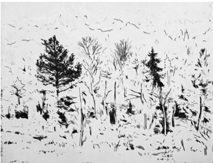
Šumavský les, lept, 14,5 x 19,5 cm, cena roku 2015