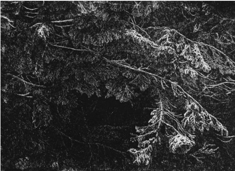
Tajemství Tmy, lept, 30 x 40 cm, 2014