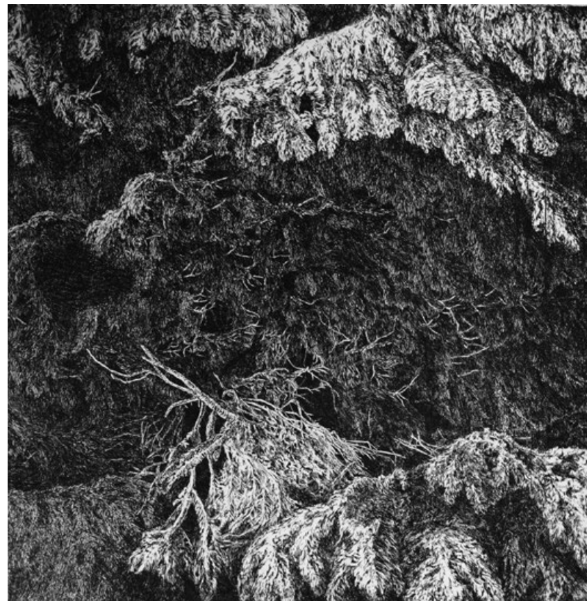
Stezka Ticha, lept, 50 x 50 cm, 2014