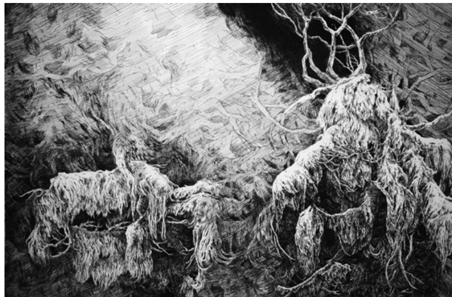
Království Prozřetelnosti, lept, 66 x 97 cm, 2014

Lidské záležitosti podléhají neustálým proměnám a pomíjivosti, zatímco krajina je tu stále. Inspiraci pro svou tvorbu čerpám především ze světa mimo civilizaci. V některých grafikách se mi propojuje můj snový svět spolu s vypořádanou realitou. Při toulkách po přírodě se mi otevírají další možné způsoby vnímání, které poté využívám v kresbě. Jde mi o zachycení vnitřní energie zobrazovaného tématu. Pocit je počátkem myšlenky, která v sobě nese vůli k bytí. Stromy a křoviny vytvářejí další prostory, které zprostředkovávají rozhovory jednotlivých míst. Své vize většinou přenáším rovnou do grafiky, v pocitu, ve kterém přicházím z lesa. Kresby nejsou realistické, jsou jen výpovědí fantazie, která dává impuls pro zpracovávání námět. V grafice se snažím využít struktury, kterou nabízí detailní kresba tenkou jehlou.