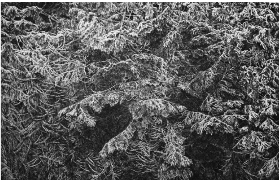
Je-li Tma klidná, pohne se Jas, lept, 55 x 58 cm, 2014